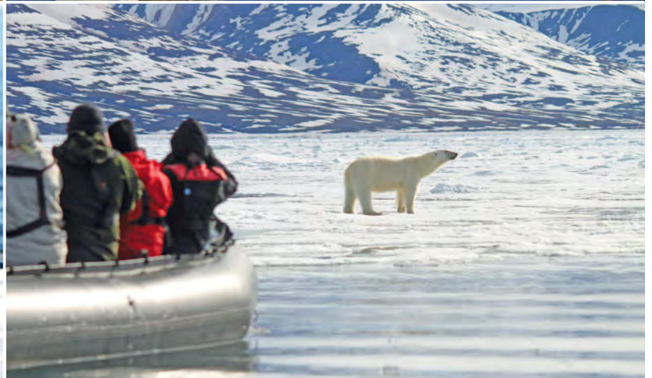
Unterwegs im Zodiac

der Nordküste Westspitzbergens geplant. Spektakuläre Gletscher dominieren die wunderschöne Szenerie, Ringel- und Bartrobber sind hier zu Hause, und auch Eisbären werden oft gesichtet. Abends geht Ihre Reise weiter in Richtung Moffen Island – hier können Sie mit etwas Glück Walrosse beobachten. Das tief stehende Sonnenlicht im Spätsommer lässt alle Landschaften in warmen Tönen erstrahlen. (FMA)