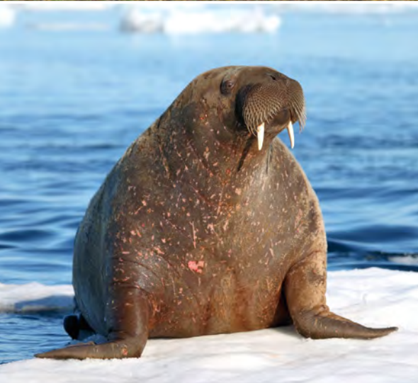
Walross in Spitzbergen